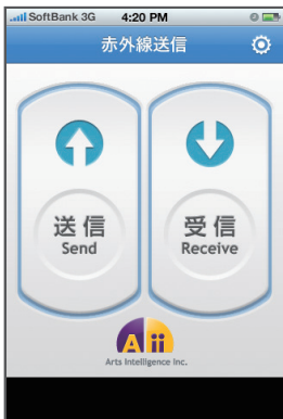
「赤外線送信」アプリ ホーム画面(例)

「赤外線送信」アプリをタップして起動してください。 アプリの操作については、ヘルプボタンからオンライン マニュアルをご覧ください。